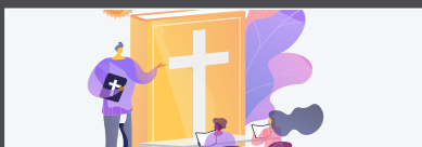
EDUCAÇÃO CRISTÃ MEC. BRUNA GRIFFO