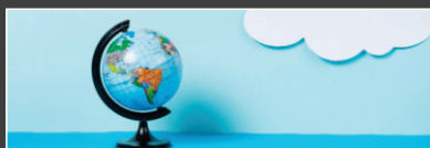
EVANGELISMO E MISSÕES